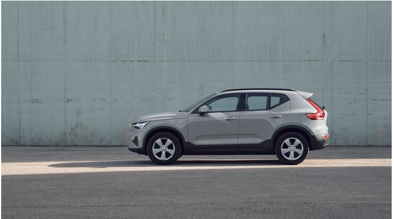
XC40 Core Außendesign

Mit diesem Konfigurations-Code unterbreitet Ihnen Ihr Volvo-Händler gerne ein konkretes Angebot